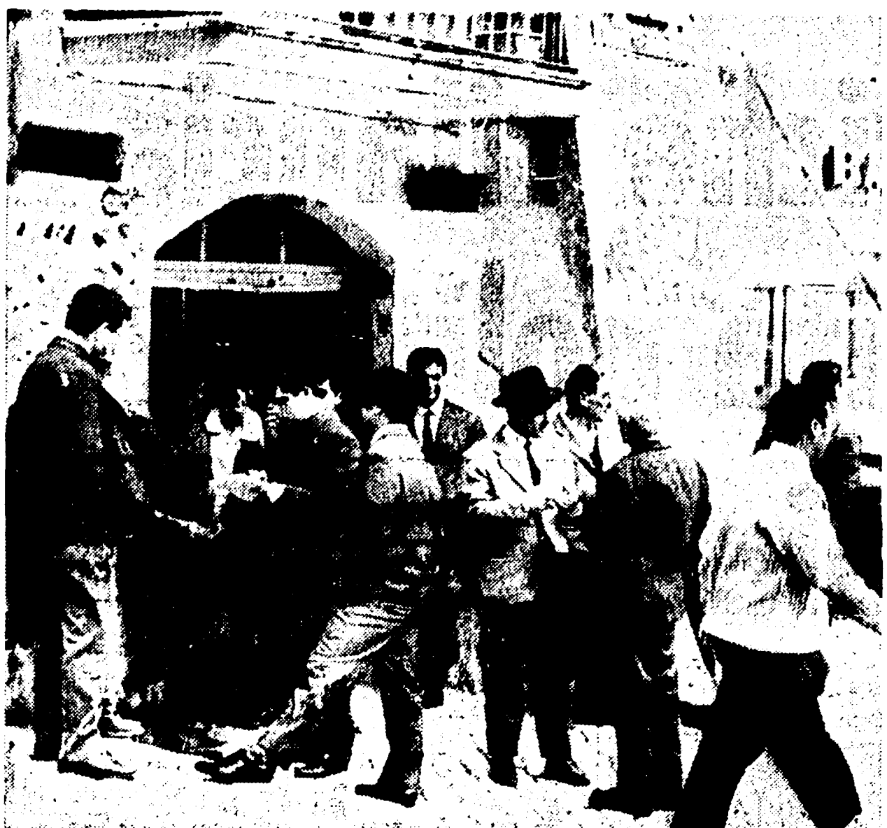
Un gruppo di disoccupati di Vicovaro a colloquio con il nostro redattore.

La grave situazione di Vicovaro e degli altri comuni del Sublucense - «La disoccupazione pesa su tutti»